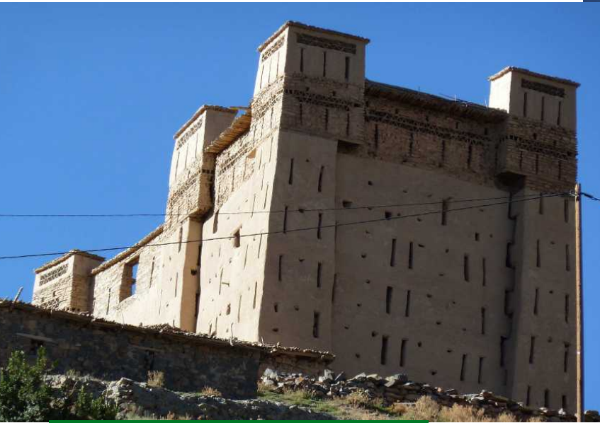
Grenier d'Amzray le haut