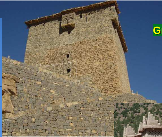
Grenier d'Amzray Le Bas