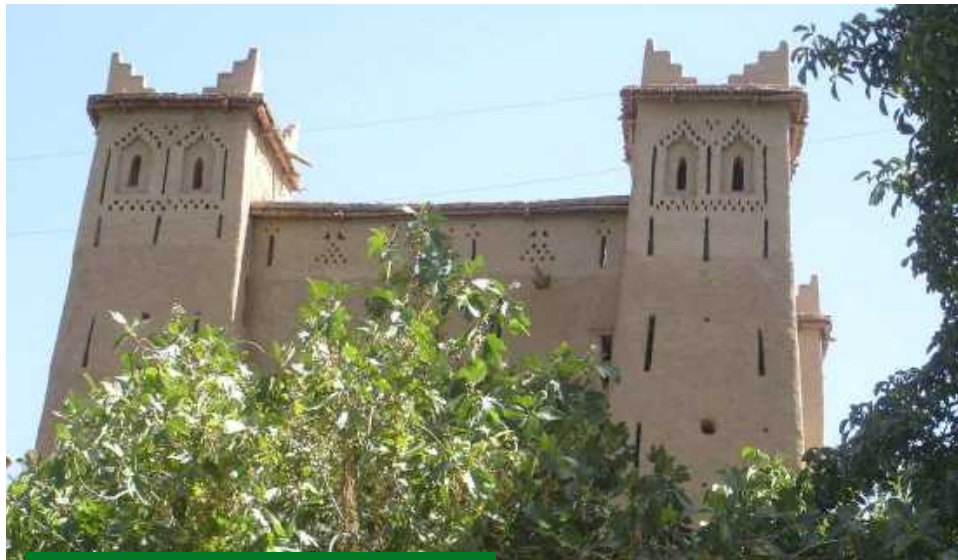
Casbah « d'Abdoulah »