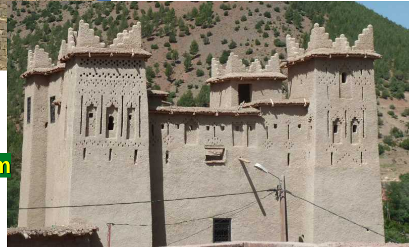
Casbah Ait Oukdim