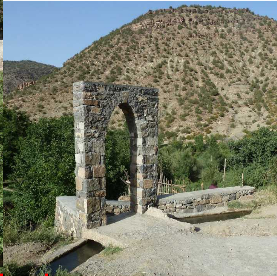
Le passage anti-mules