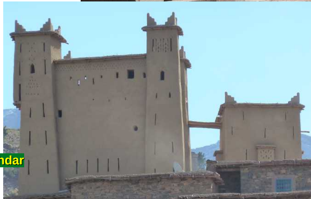
Casbah Ait Amahdar