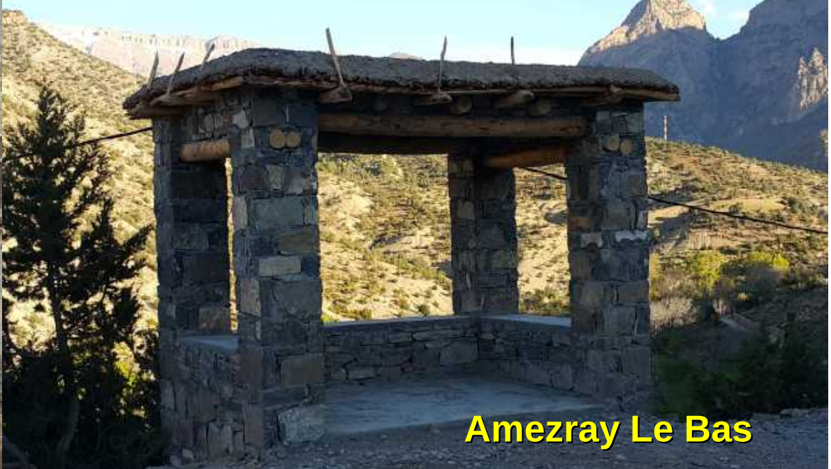
Amezray Le Bas