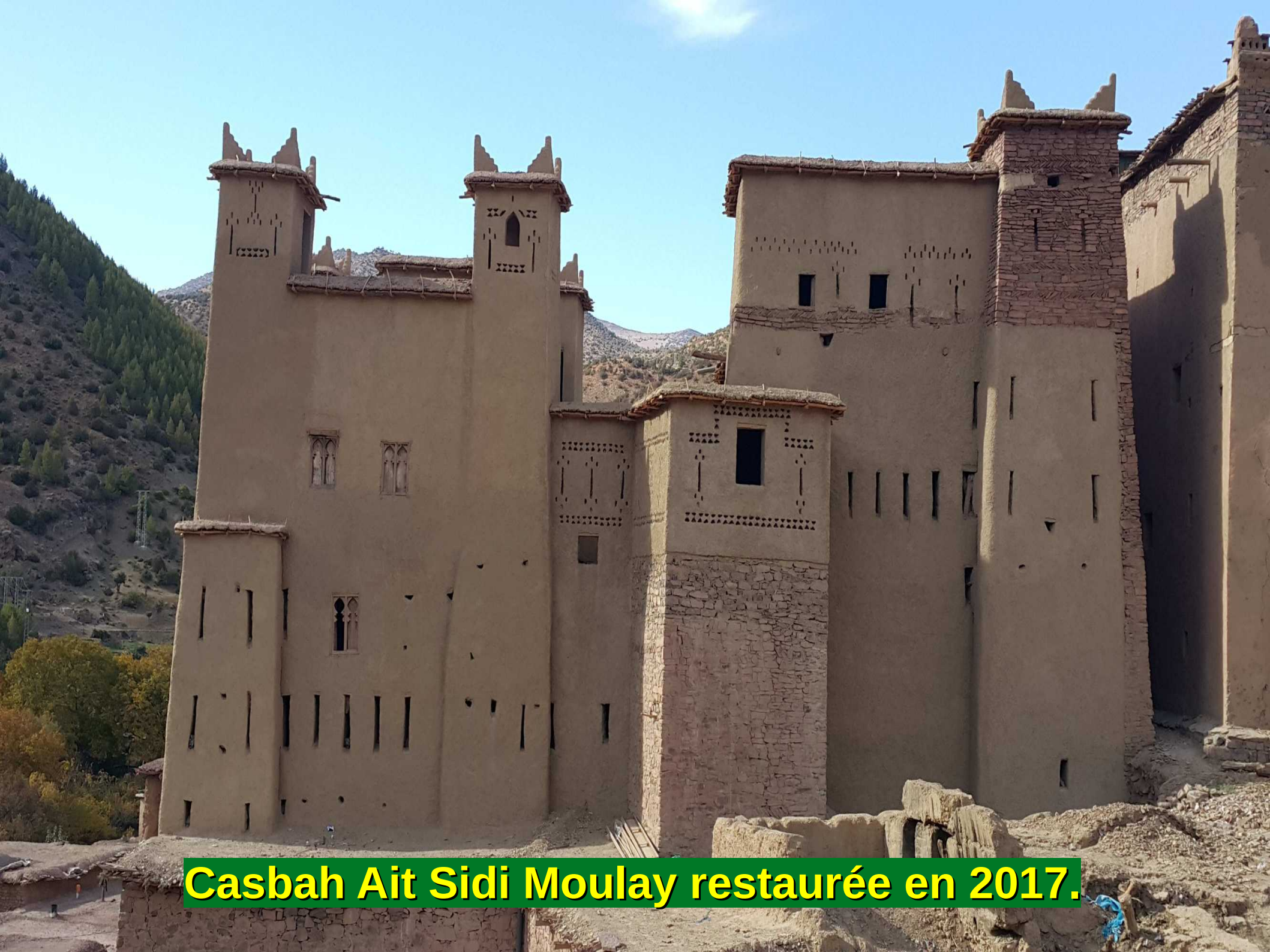
Casbah Ait Sidi Moulay restaurée en 2017.