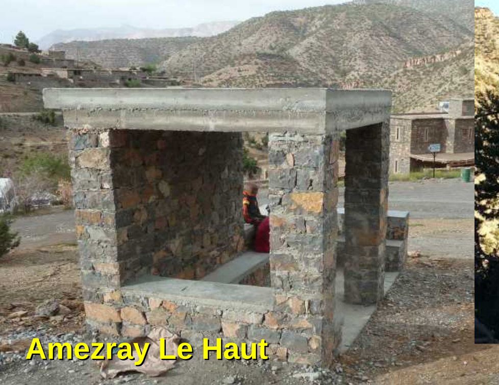
Amezray Le Haut